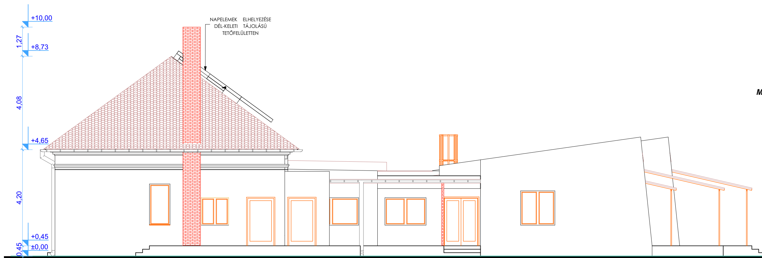
DÉL NYUGATI HOMLOKZAT M=1:100